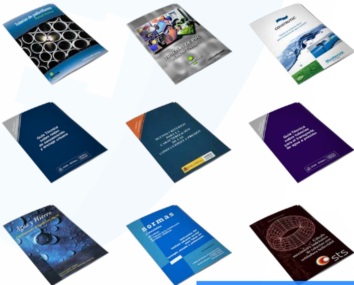
Algunas de las publicaciones entregadas a los asistentes durante las diferentes ediciones del Curso sobre Diseño de Tuberías