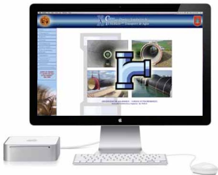
Web del Curso sobre Diseño de Tuberías ( www.cursotuberias.com )