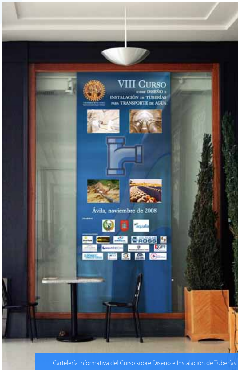
Cartelera informativa del Curso sobre Diseño e Instalación de Tuberías

El Curso ha ido evolucionando de una forma natural desde las primeras ediciones en las que tenía un carácter más universitario y académico a las últimas con un corte marcadamente profesional, configurándose en su formato actual como un híbrido entre un Curso académico convencional (de contenidos repetitivos en todas